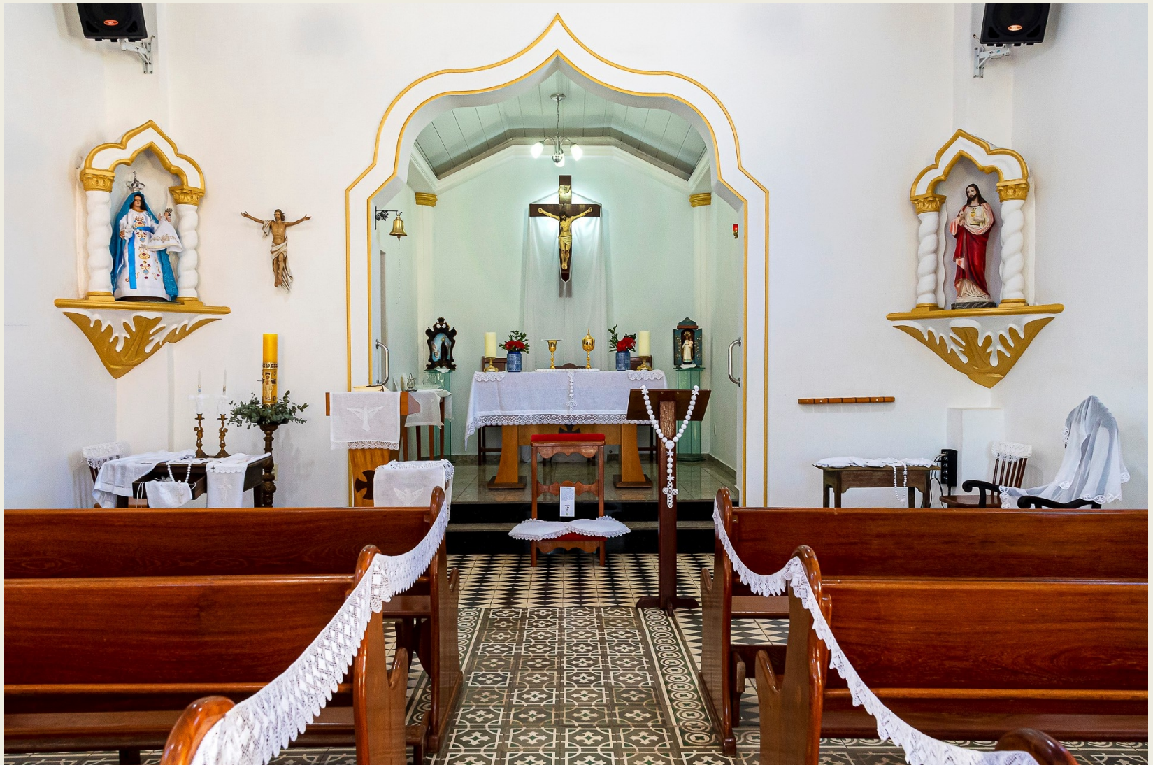
Mostra Tradição e Religiosidade em Rendas de Bilro