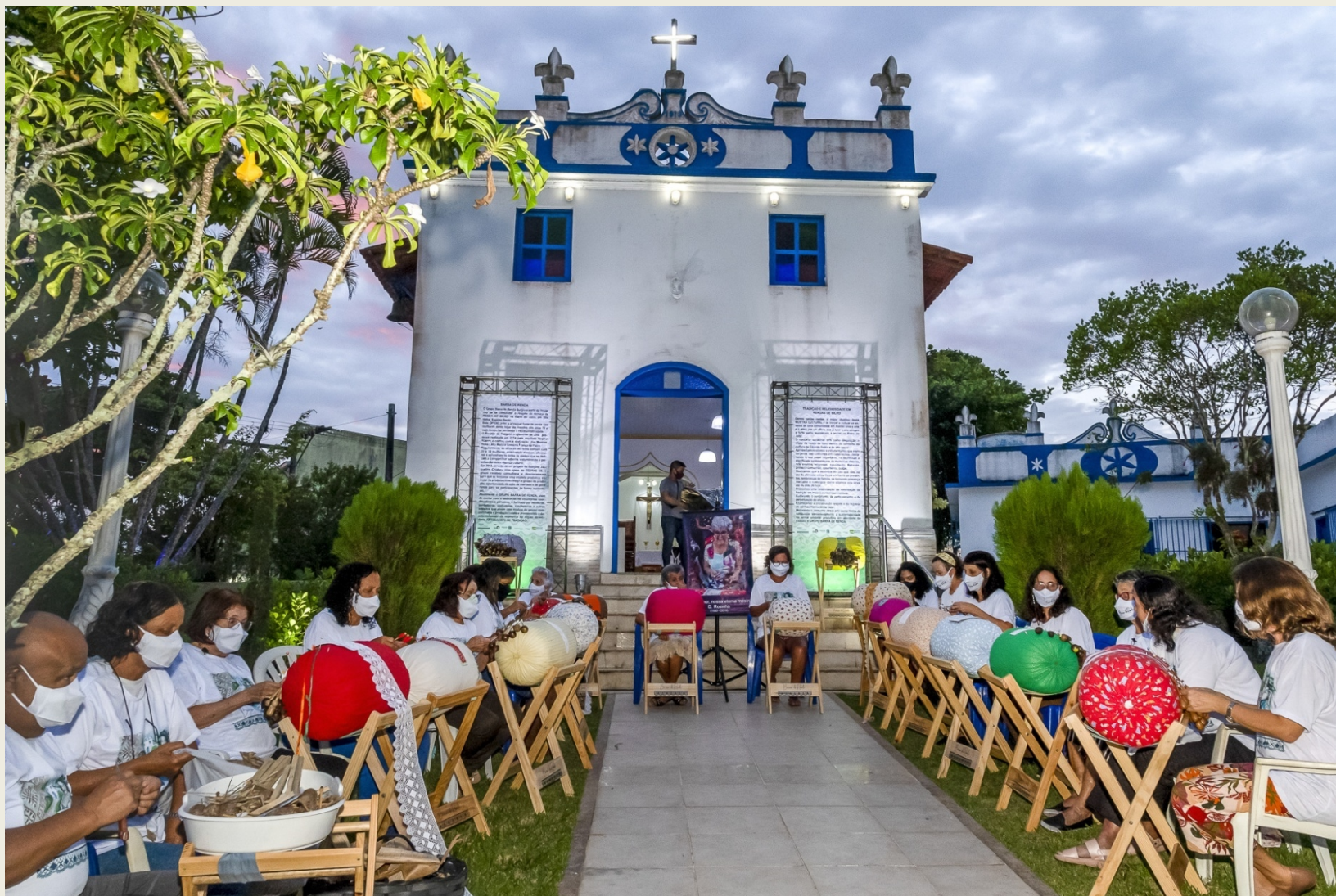
Roda de rendeiras do grupo Barra de Renda Barra do Jucu