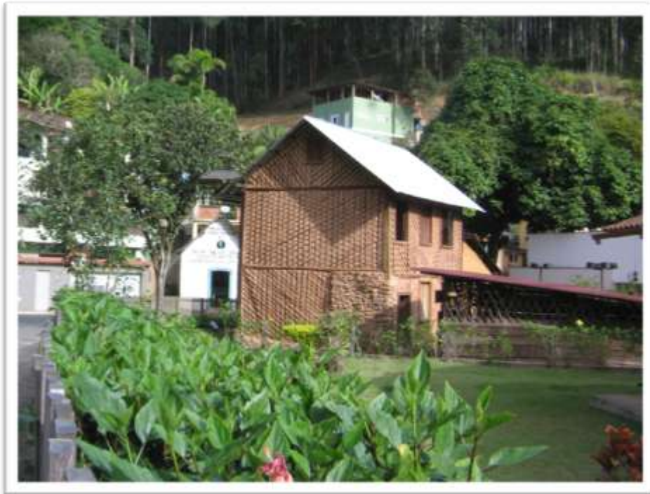
Figura 5 – Casa Lambert e Capela de Nossa Senhora da Conceição (à esquerda). Santa Teresa. ES.