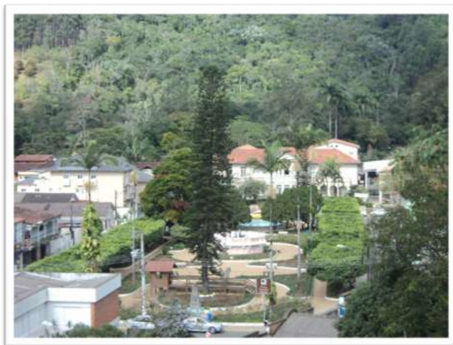
Figura 1 – Praça Augusto Ruschi, vendo, ao fundo, a Escola Santa Catarina.

A cidade é pequena, cercada de farta vegetação, e tem na Praça Augusto Ruschi o seu núcleo paisagístico de lazer (Figura 1). Em torno da praça estão dois belos colégios locais: a EMEI Pessanha Póvoa, antigo grupo escolar fundado em 1929, e a Escola Santa Catarina, fundada em 1946.