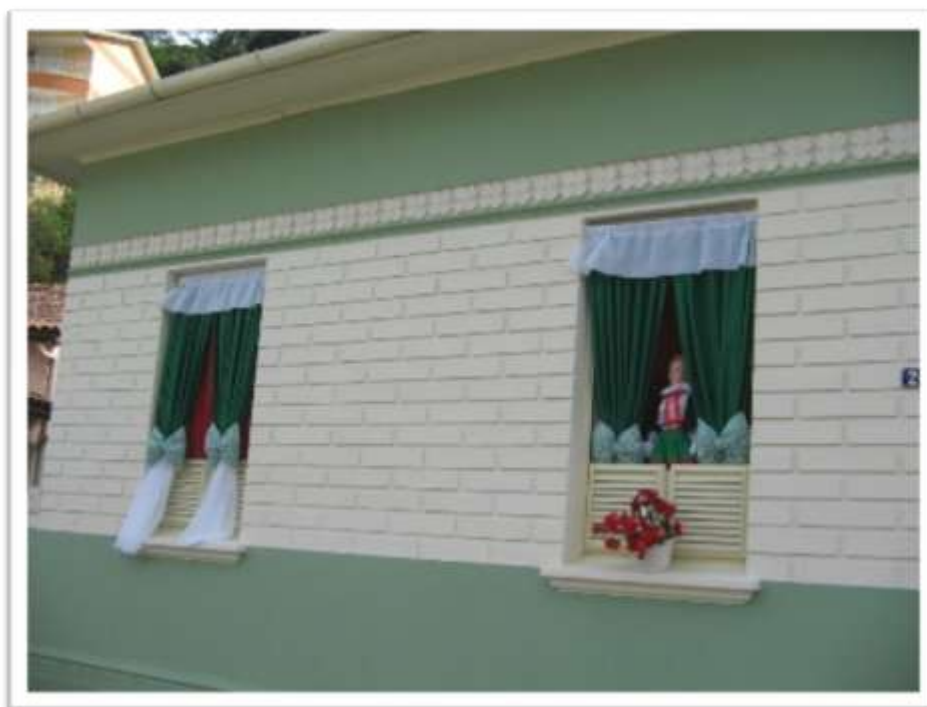
Figura 3 – Casa enfeitada para a festa do Imigrante Italiano. Santa Teresa. ES.

Santa Teresa promove a Festa do Imigrante Italiano, em junho, quando a cidade se enfeita com as cores da bandeira da Itália. Nessa época, é comum ver nas janelas da cidade cortinas com as cores da bandeira italiana e bonecos vestidos com roupas de danças típicas do folclore italiano (Figura 3).