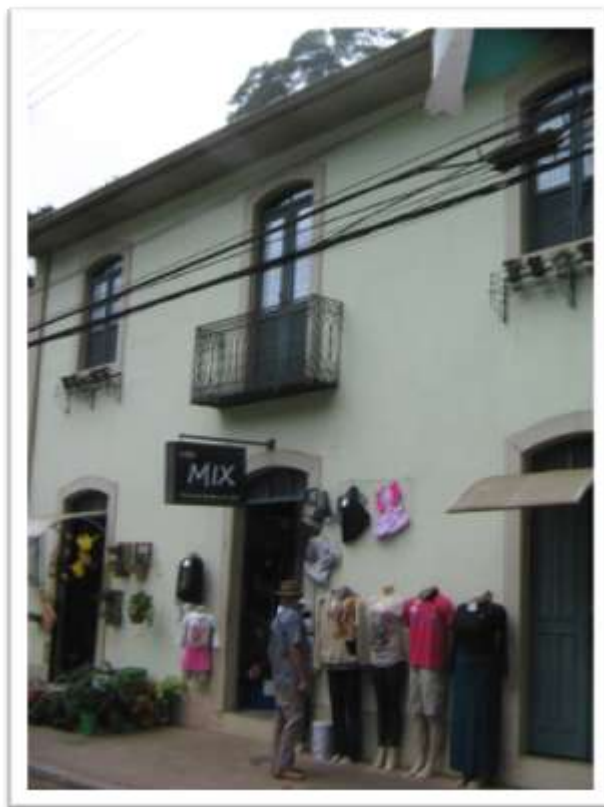
Figura 7 – Residência Augusto Ruschi.

Santa Teresa possui uma lei Municipal de Tombamento. Com o apoio da Secretaria de Estado da Cultura, que instruiu um processo de tombamento no centro da cidade, a Prefeitura Municipal de Santa Teresa está estudando o tombamento de imóveis em seu perímetro urbano.