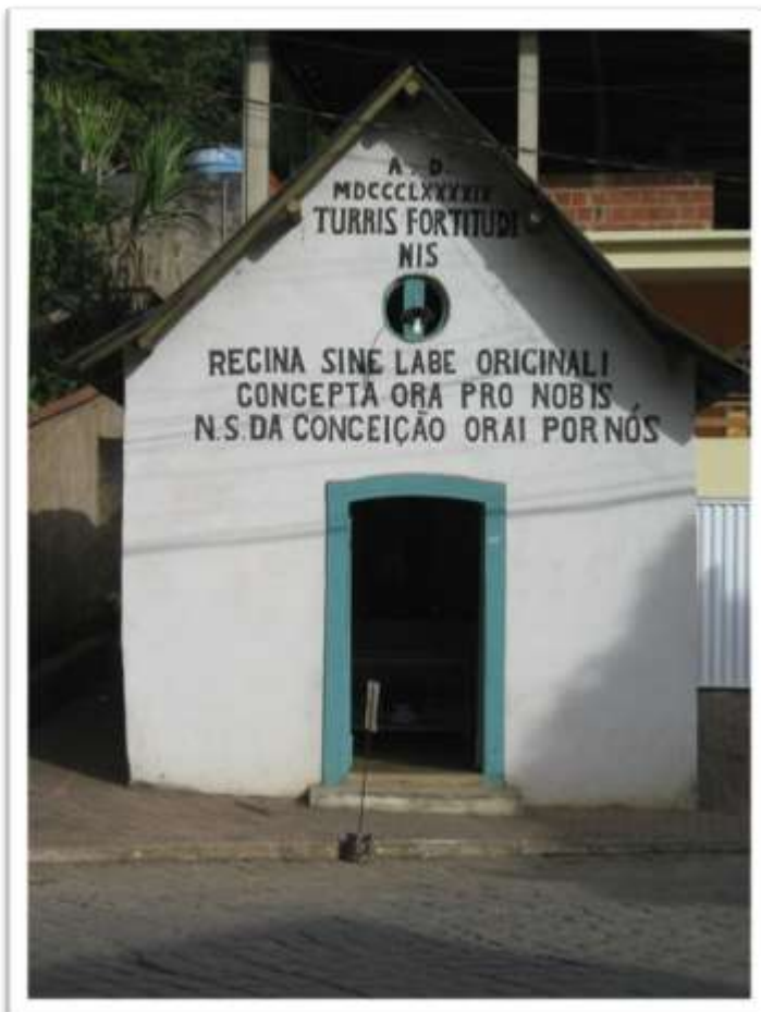
Figura 6 – Capela de Nossa Senhora da Conceição. Santa Teresa. ES.