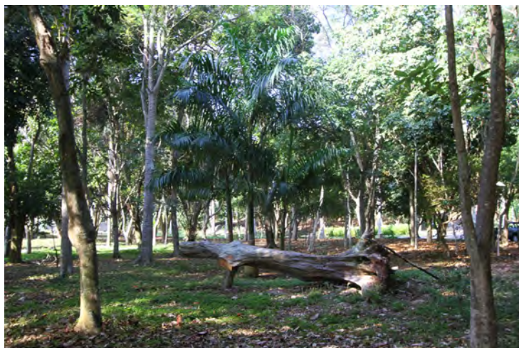
PARQUE CULTURAL CASA DO GOVERNADOR